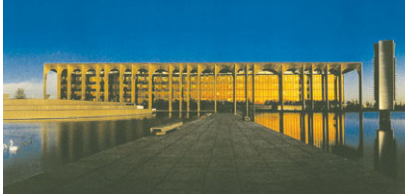
Mondadori Sarayı, Milano.